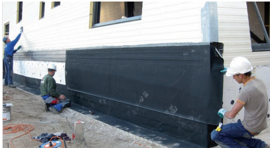
Op de voorgesmeerde panelen wordt zelfklevende EPDM aangebracht.

De eerste stap in het onderzoekstraject was het bepalen van het kruipgedrag van de stalen sandwichpanelen met de PUR-isolatiekern. Onder invloed van het gewicht van het metselwerk vervormt het kernmateriaal van PUR. Dit noemen ook wel kruip. Op 5 proefstukken van 200 mm breed en 1.000 mm lang zijn vierpuntsbuigproeven uitgevoerd volgens de RS 1990.