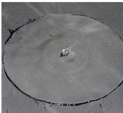
Bevestiging rvs clip ten behoeve van spouwanker.

De gestante lip steekt in het midden door een kleine inkeping in de EPDM-rozet. In de gaatjes van de rvs lip worden rvs spouwankers gehaakt. Deze worden in de lintvoegen van het metselwerk opgenomen. Op de rozetten zijn in het laboratorium trekproeven uitgevoerd. De uittrekwaarde bleek ruim voldoende te zijn voor de toepassing. Hiermee was het probleem van de spouwankers opgelost.