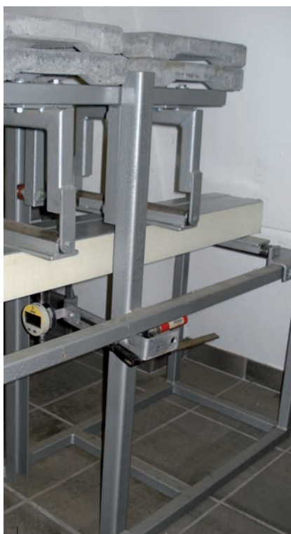
Vierpuntsbuigproef ten behoeve van sterkte en stijfheid panelen.

Ook de waterdichtheidsprestaties van de gevelopeningen, opgenomen in het metselwerk, waren niet of onvoldoende inzichtelijk. Vooral de waterdichtheid van de kozijnen zelf en de bouwkundige details verdienden veel aandacht.