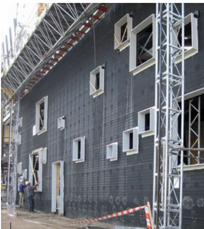
Houten stelkozijnen ter plaatse van de gevelopeningen.

Geadviseerd is de gevelopbouw aan te passen en te kiezen voor een stabiele betonnen onderconstructie waarbij de gevel eerst geheel waterdicht wordt ingewerkt met een dakbedekking. Hierop kan vervolgens XPS-isolatie worden aangebracht (het zogenoemde omgekeerd dakprincipe). Veel van eerdergenoemde problemen kunnen dan eenvoudiger worden opgelost. Het project was reeds in een stadium dat een betonnen binnenblad niet meer mogelijk was. De staalconstructie was al gereed en ontworpen op een lichte achterconstructie.