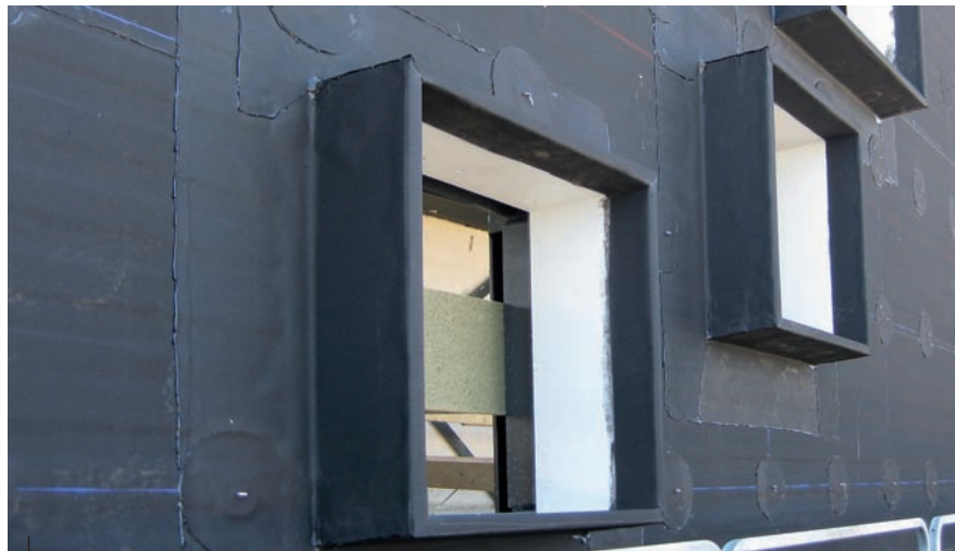
Ingeplakt houten stelkozijn.

De proefstukken zijn in het midden ruim 500 uur belast met een statische belasting van 0,412 kN (ongeveer 41 kg). De vervorming is direct gemeten na het aanbrengen van de belasting en vervolgens periodiek. Aan de hand van de toename van de vervorming is de kruipfactor bepaald. Hiermee is de totale doorbuiging te berekenen en te voorspellen voor langere termijn. De vervorming van de geteste panelen bleek te voldoen aan de gestelde eisen. Ook is gekeken naar de maximaal toelaatbare vervorming van het metselwerk in verband met scheurvorming. Om ongecontroleerde scheurvorming tegen te gaan, moest het metselwerk worden gedilateerd bij de oplegging van de panelen op de achteroverliggende stalen gevelkolommen.